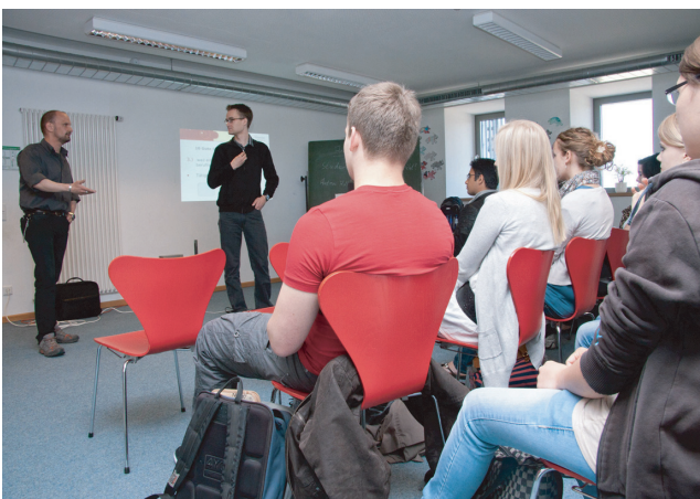
Mentoren von Arbeiterkind.de bei einem Schulbesuch.

Weitere Informationen unter www.arbeiterkind.de