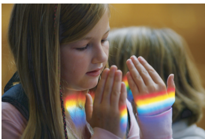
‚Warum ist der Regenbogen bunt und rund‘ hieß die Vorlesung am zweiten Tag der 9. Frankfurter Kinder-Uni.