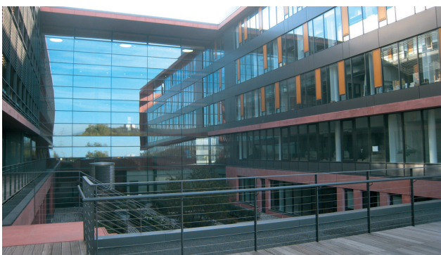
In den vier schön gestalteten Innenhöfen des Biologiums können Studierende ausspannen.

Noch nutzen 12.000 Studenten den alten Campus Bockenheim, davon rund 4.500 Naturwissenschaftler. Der Umzug aller naturwissenschaftlichen Fachbereiche in ihr modernes neues Heim dauert wohl vier Jahre länger als geplant. Doch darüber lässt sich hinwegsehen, denn trotz angespannter Haushaltslage müssen keine Abstriche gemacht werden. Das Land Hessen investiert im Zeitraum 2000 bis 2019 insgesamt 650 Millionen Euro in den Campus Riedberg. „Alles wird so gebaut, wie wir es uns gewünscht haben“, sagt Rost. Wenn 2019 alles fertig ist, haben die Naturwissenschaftler einen hochmodernen Campus. (lw)