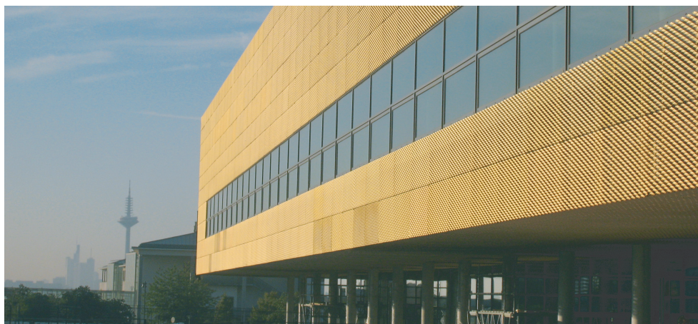
Das Otto-Stern-Zentrum ist nach dem gleichnamigen Physiker und Nobelpreisträger benannt, der 1914 als erster Privatdozent nach Frankfurt kam.

Die drei Baumaßnahmen, entworfen von Gerber Architekten aus Dortmund, haben ein Investitionsvolumen von 150 Millio-