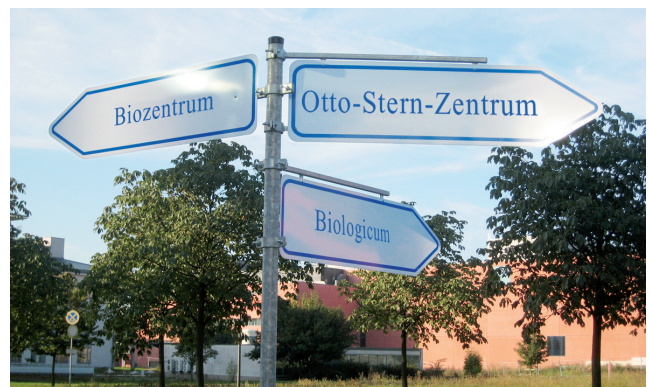
Wegweiser helfen bei der Orientierung auf dem neu gestalteten Campus Riedberg.

Im kommenden Jahr wird eine Kindertagesstätte gebaut. Es gibt einen großen Bedarf an Betreuungsplätzen, derzeit aber nur eine provisorische Kita mit 40 Plätzen. In der neuen Kita an der westlichen Ecke des Campus sollen bis zu 135 Kinder betreut werden. Auch Schüler des Riedberg-Gymnasiums profitieren von der Science City. Das Gymnasium mit natur-