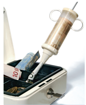
Die Goethe-Universität erhält für Forschungsprojekte eine kräftige Finanzspritze