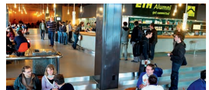
Professionell: Europäische Alumni-Büros nach US-Vorbild