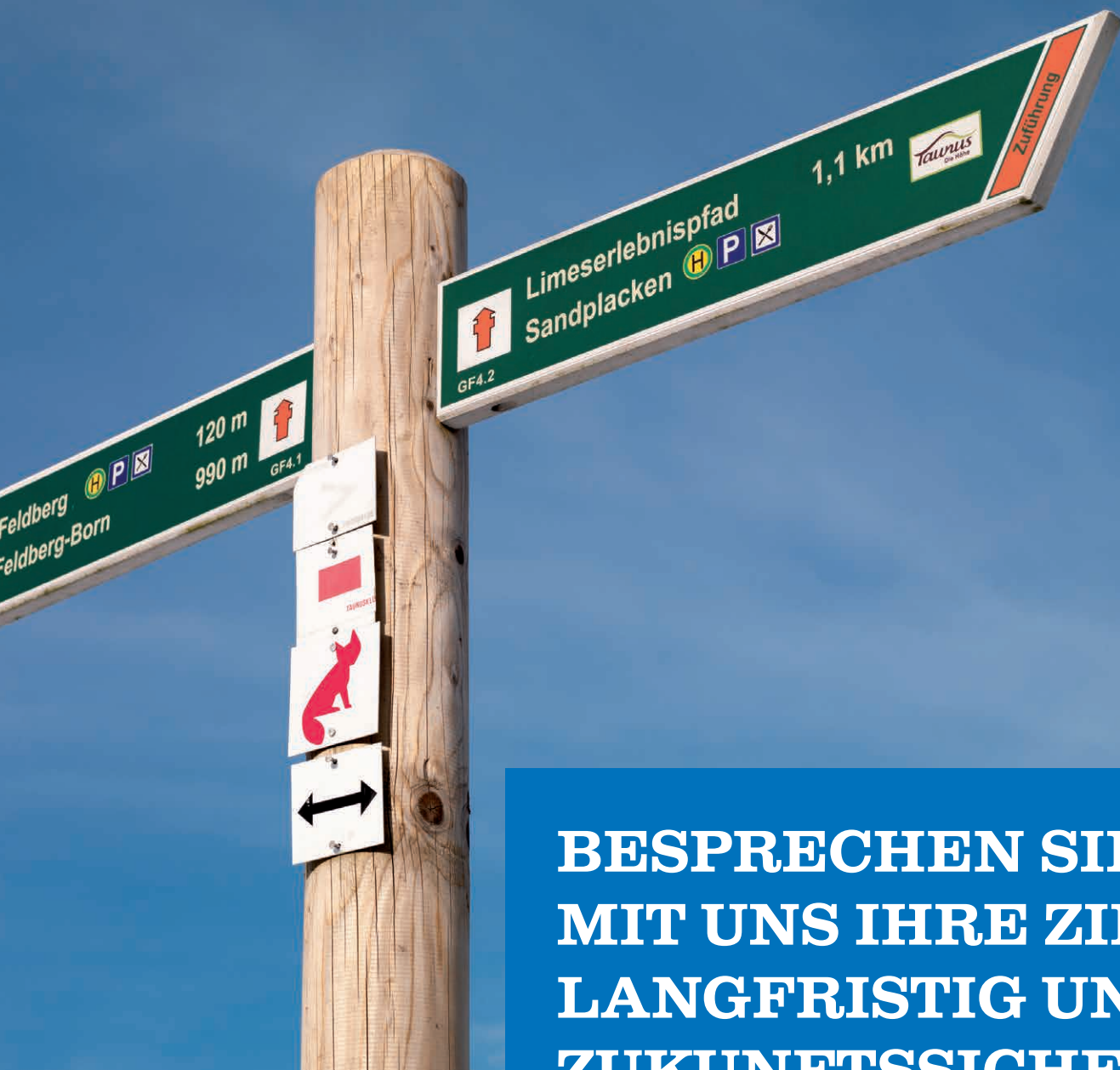
Wegweiser im Taunus.

BESPRECHEN SIE MIT UNS IHRE ZIELE. LANGFRISTIG UND ZUKUNFTSSICHER.