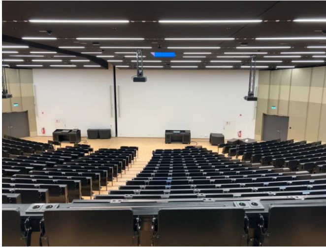
Großer Hörsaal A+B von oben