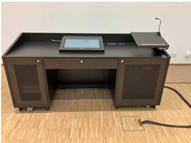
Medienpult Hörsaal A von vorne