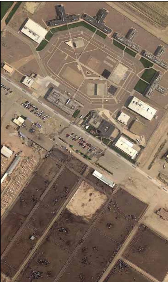
Foto 3: Four Mile Correctional Center, Canon City (Colorado). Oben im Bild die Anlagen zum Einschluss der Gefangenen, unten die zum Einschluss der Pferde