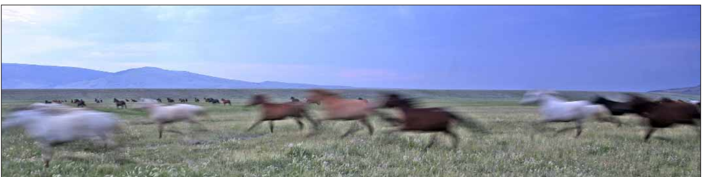
Foto 1: Mustangs auf der Deerwood Ranch (Wyoming). Derzeit hat das Bureau of Land Management Verträge mit 60 Farmern, auf deren Land eingefangene Wildpferde leben

Für gesellschaftliche Vorstellungen von Wildnis sind Wildtiere wie Mustangs – in Anlehnung an Macnaghten und Urry (1998) – konstitutiv. Der Umgang mit ihnen ist deshalb nicht zu verstehen, ohne die jeweils vorherrschenden gesellschaftlichen Diskurse über Wildnis zu kennen. Am Beispiel USA lässt sich nachvollziehen, wie sich solche Diskurse mit der Zeit verändern und wie dies immer auch mit einem Wandel der praktischen Mensch-Wildpferd-Verhältnisse einhergeht. So herrschte zur Zeit der Besiedlung des Westens eine eher liberalistische Vorstellung von Wildnis vor, die Wildnis als noch nicht für wirtschaftliche Zwecke verwertetes Land, als „Verfügmassse“ (Mutschler 2002, S. 211) ansah. In den USA führte dieses Verständnis von Wildnis dazu, dass wild lebende Pferde nicht geschützt, sondern nach primär ökonomischen Gesichtspunkten als natürliche Ressource oder natürliches Hindernis für wirtschaftliche Aktivität wahrgenommen wurden. Bis in die 1950er-