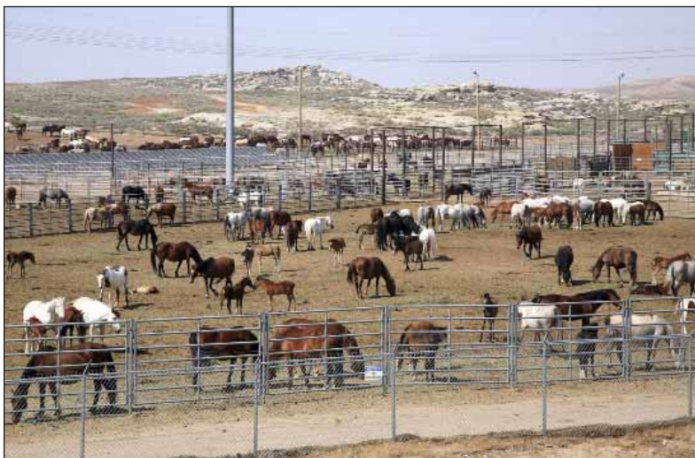
Foto 2: Rock Springs Wild Horse Holding Facility (Wyoming), in der das Bureau of Land Management etwa 800 Mustangs hält. Im Vordergrund das Gehege für Stuten mit in der Einrichtung geborenen Fohlen

Karte: verändert nach de Steiguer 2011, S. 86