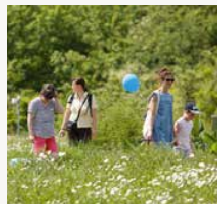
Familienausflug zum Frühlingsfest.

Gartenbesitzer und Balkonliebhaber gibt es ein besonderes Highlight: Sie können überzählige Setzlinge von den Gärtnern des Wissenschaftsgartens übernehmen. Gegen eine Spende erhalten sie außergewöhnliche Pflanzen, die nicht in jedem Garten- und Blumengeschäft zu finden sind. Das Frühlingsfest wird ermöglicht durch die Unternehmen Immo Herbst, BBBank und Engelhard Arzneimittel. ■