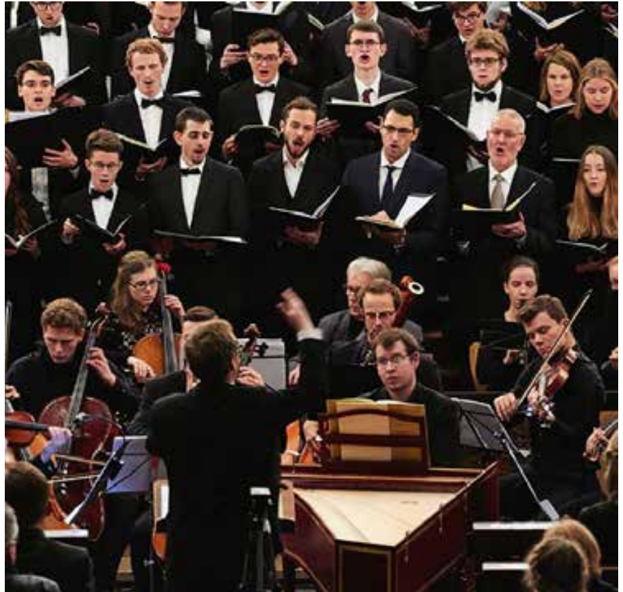
Ambitioniert und mit Enthusiasmus: Der Chor und das Orchester des Collegium Musicum der Goethe-Universität.

Collegium Musicum lädt zum Mitsing-Konzert!