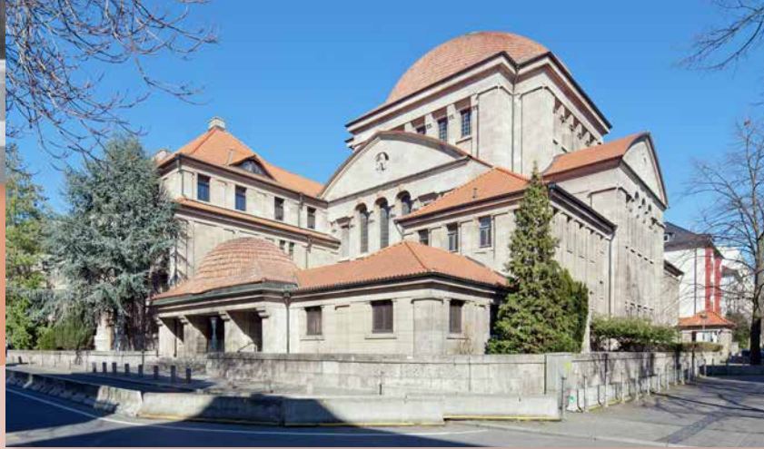
Die Westendsynagoge heute.