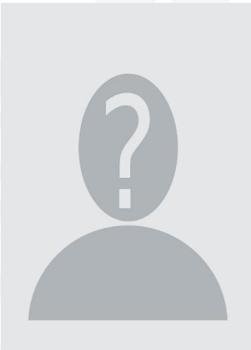
N.N Junior Revisor*in/ Sachbearbeiter*in