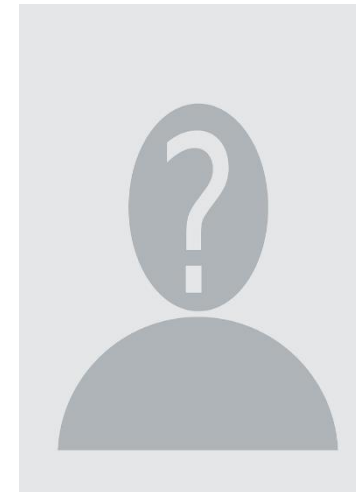
N.N Junior Revisor*in/ Sachbearbeiter*in