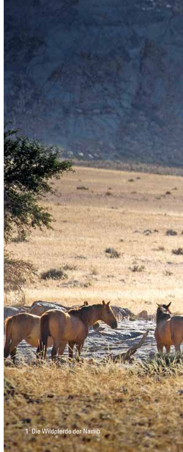
1 Die Wildpferde der Namib

Als Teil des Nationalparks gerieten die Wildpferde in den Fokus einer internationalen tou-