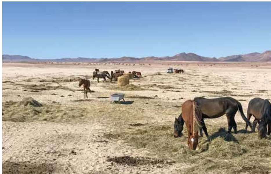
7 Fütterung der Wildpferde bei Garub

Lorimers Arbeiten, wie die anderer aus der »more-than-human«-Perspektive argumentierender Wissenschaftlerinnen und Wissenschaftler, sind in der Konsequenz zunächst einmal als Bemühungen um alternative Ontologien von Natur zu sehen, die ermöglichen, neben der diskursiven Dimension anderen, vor allem erfahrungsbezogenen Dimensionen der Bestimmung von Natur und Wildnis Einlass zu gewähren. Wie sie in die konkrete Naturschutzpraxis überführt werden können, ist derzeit noch offen und führt in grundlegende Debatten über Wissenschaftstheorie, aber insbesondere auch zu Fragen der Tier- und Umweltethik. Pilotprojekte, die neue Wege