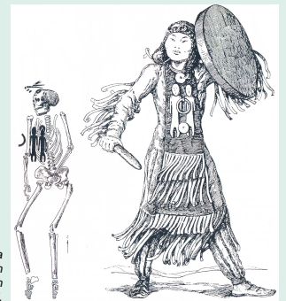
Abb. 5: Bronzezeitliche Bestattung von Ust'Uda (Sibirien), aufgrund der beigegebenen anthropomorphen Figuren als Schamanin rekonstruiert [DEVLET 2001, 52].

Kurz gesagt: Innerhalb der Archäologie bedienen wir uns meist einer unscharfen, schwammig definierten Konzeption , wenn wir ein von der Norm abweichendes Grab als das eines „Schamanen“ interpretieren.