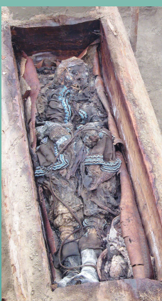
Abb. 3: Die Bestattung von Kyys (1726), Republik Sacha (Jakutien), wurde reich mit Beigaben ausgestattet, zugleich aber mehrfach gefesselt. Ein Birkenbäumchen setzte man rituell auf den Sarg [CRUBÉZY 2007, 21].