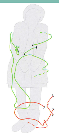
Abb. 4: Umzeichnung der Bestattung von Kyys. Die einzelnen Fesseln aus Leder sind farbig markiert [CRUBÉZY 2007, 25].