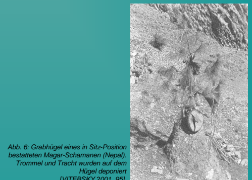
Abb. 6: Grabhügel eines in Sitz-Position bestatteten Magar-Schamanen (Nepal). Trommel und Tracht wurden auf dem Hügel deponiert [VITEBSKY 2001, 95].

Daher wird in einem zweiten Schritt der hier vorgestellten Arbeit eine Datenbank mit Sonderbestattungen dieser Zeitstufen erstellt werden, um mögliche Tendenzen erkennen zu können. Sollten sich innerhalb der genannten Regelabweichungen Gruppierungen feststellen lassen, die auf überregionale Brauchtümer und Traditionen hindeuten, wird zu prüfen sein, ob das Phänomen „Schamanismus“ tatsächlich als Erklärungsansatz für Sonderbestattungen des Endneolithikums und der Frühbronzezeit in Erwägung gezogen werden kann.