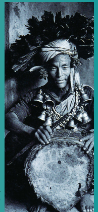
Abb. 2: Schamane der Magar (Nepal) in voller Tracht [VITEBSKY 2001, 55].