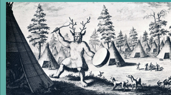
Abb. 1: Tungusischer Schamane (Sibirien), Kupferstich von 1705 [OPPITZ 1981, 275].

Dass dabei aber ein ethnographisch überlieferter Begriff verwendet wird, der bei der Übertragung jeden Bezug zu den Bestattungsformen des Ursprungsbereiches verliert, ist den meisten Archäologen nicht bewusst.