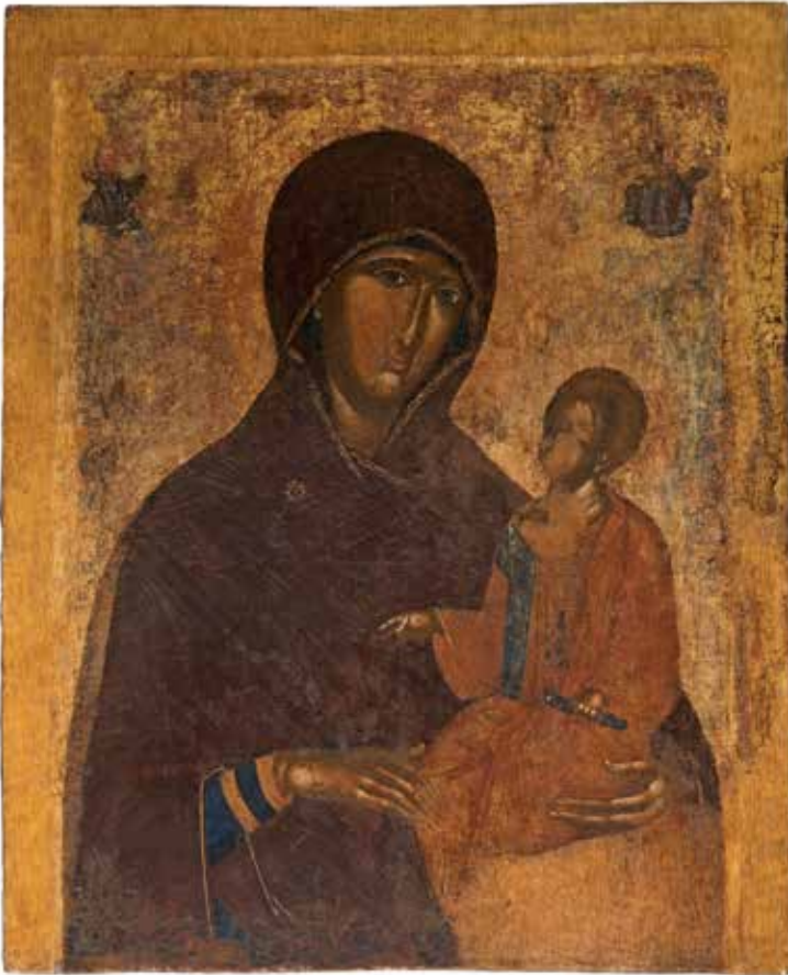
2 Ikone mit der Jungfrau und dem Kind, 1300–1350 entstanden in Konstantinopel. Tempera auf Holz mit Blattgold. Byzantinisches Museum Athen.

tum wegen des Glaubens an die Menschwerdung Gottes eine Sonderrolle einnimmt. Der Vorwurf der Götzenverehrung richtet sich in der Bibel explizit an die Heiden. Doch diese waren in späteren Auseinandersetzungen um Gottesbilder gar nicht beteiligt. Vielmehr ist zu beobachten, dass Bilderstürme sich meistens zwischen monotheistischen Religionen oder Konfessionen ereignen.