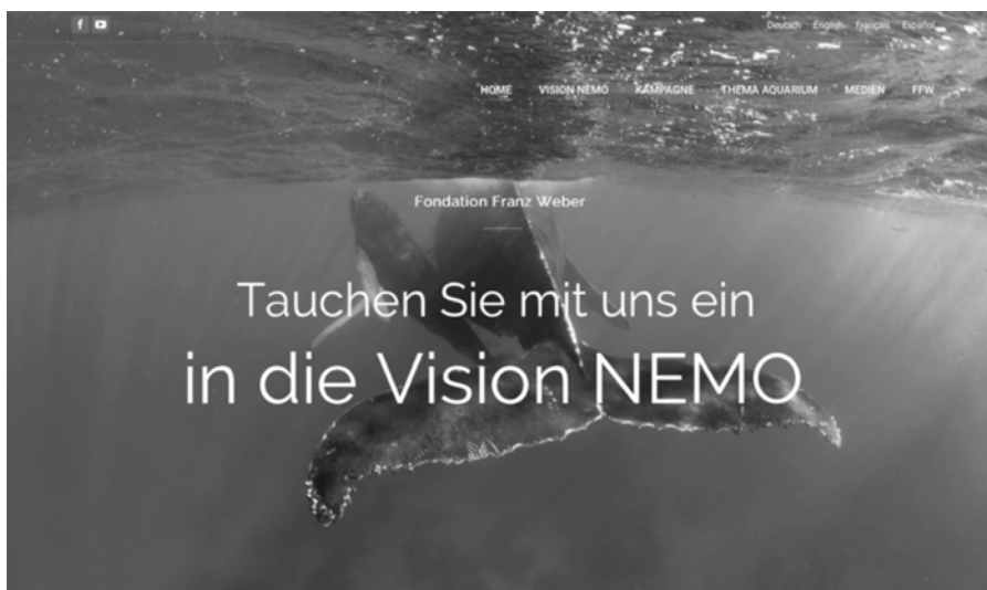
Abb. 2: Startseite der Vision NEMO

vernetzte, zeitechte und interaktive Präsentation der blauen Welt durch Vision NEMO ist heute realitätsnäher als das überholte Konzept eines Ozeaniums. [...] Computeranimation, IMAX- und XD-Technologie, einhüllende und interaktive Projektion, verbunden mit immer neueren technischen und digitalen Errungenschaften machen Vision NEMO zum sinnlich-aktiven, zum unvergesslichen Erlebnis.« 6 Die »Vision NEMO« ist ganz wie das Ozeanium selbst auch als ein großes Gebäude mit unterschiedlichen Räumen geplant und soll damit die Online-Situation vor dem heimischen Computer bei Weitem übersteigen, vor allem über entsprechend große Projektionsflächen und Surround-Techniken. So fordert die Fondation Franz Weber den Basler Zoo explizit dazu auf, anstelle des geplanten Ozeaniums – am gleichen Ort, mit dem gleichen Geld – das von ihnen umrissene Projekt »Vision NEMO« zu realisieren.