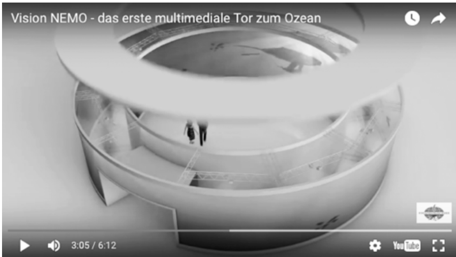
Abb. 4a u. 4b (rechte Seite): Filmstills aus »Vision NEMO – das erste multimediale Tor zum Ozean« (03:05 und 03:06)

bar, was sich in der Wand befindet: nicht Wasser und Fische, sondern Luft und Technik.