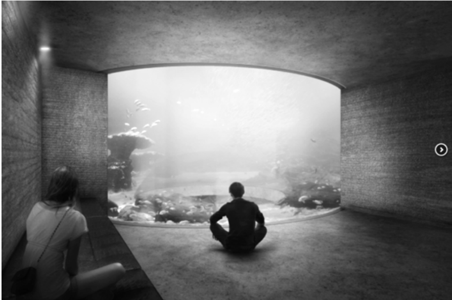
Abb. 3: Visualisierung des Projekts NEMO